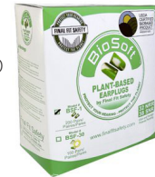
BSF-30 VPE 100 PAAR